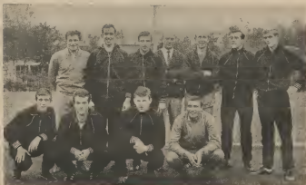
E EQUIPO VOETBALISTICO HULANDES